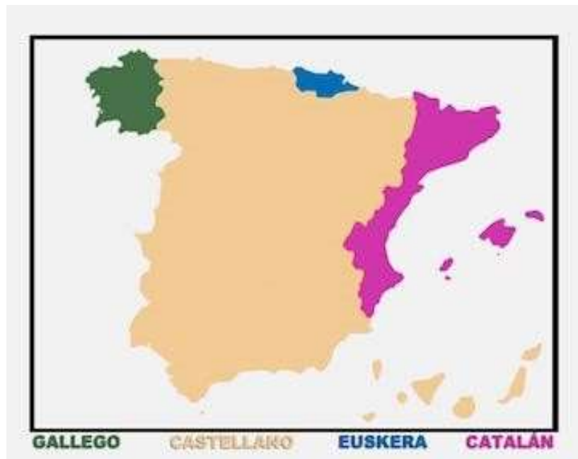
Imagen. Las lenguas de España.