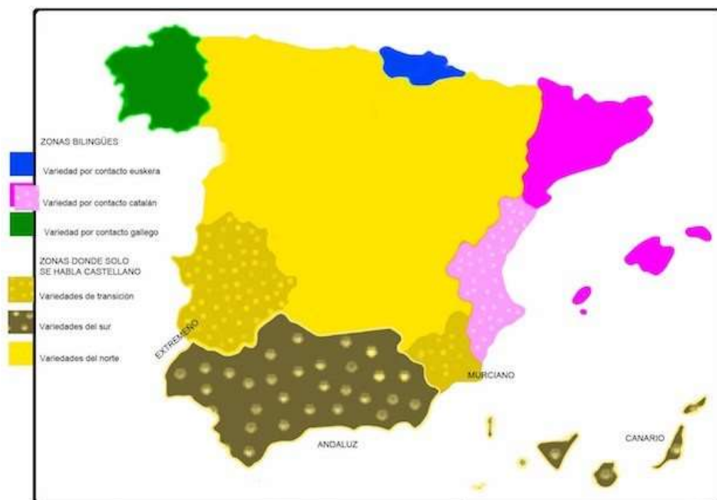
Imagen nº 2: Variedades del castellano.

A causa de esto son frecuentes las interferencias, es decir, los intercambios de elementos lingüísticos entre las lenguas. Por ejemplo, la Comunidad Valenciana, es común el uso diferente de las preposiciones en castellano por influjo del valenciano (Ej. Ponte al centro, en lugar de Ponte en el centro o Los hay de mejores en lugar de Los hay mejores), y en Galicia, la pérdida del pronombre en algunos verbos pronominales por influjo del gallego (Ej. Ya marchó en lugar de Ya se marchó).